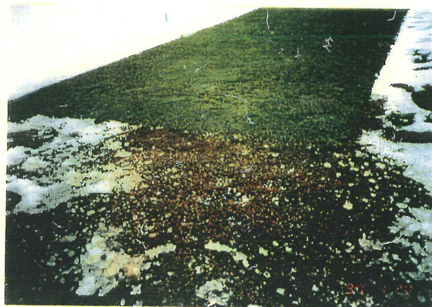
土壌の温度が5°C程度高い為、雪の積雪が無い