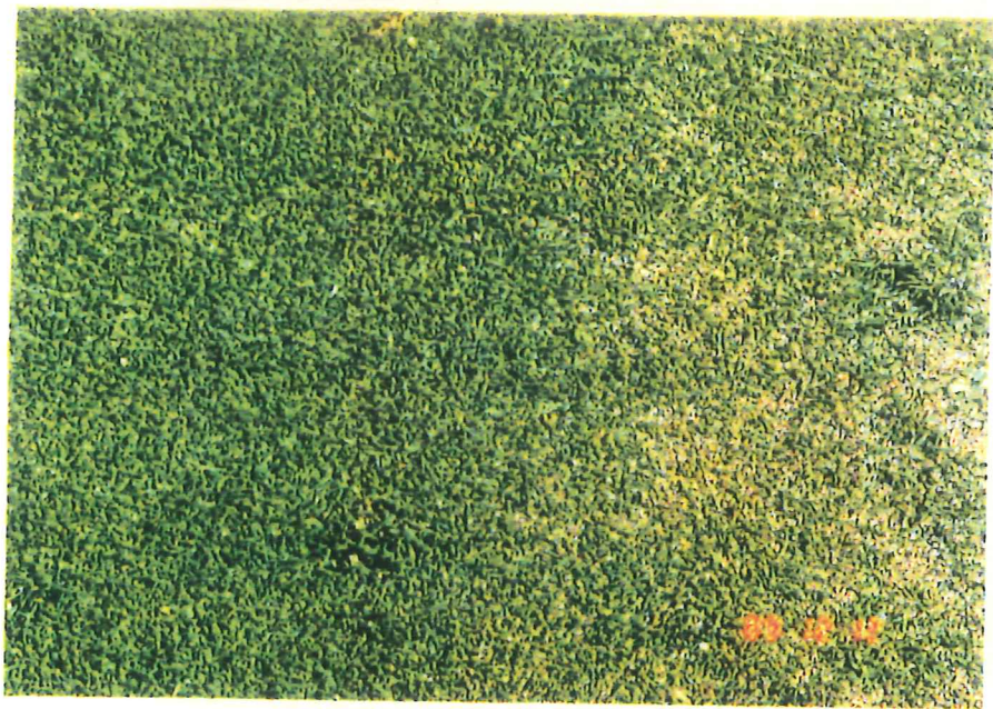
他の芝生より、生育が30日程度早い